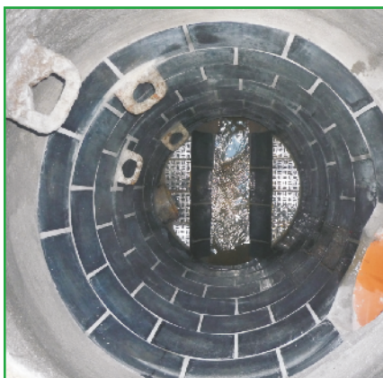
Stav šachty po sanaci