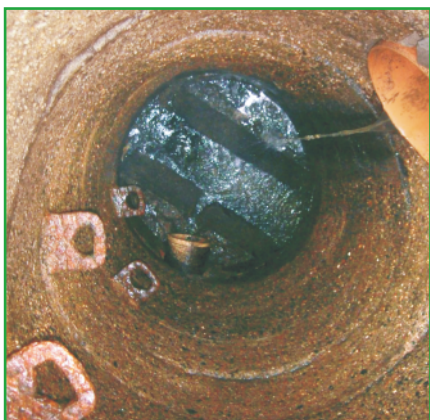
Stav šachty před sanací

pro lepení keramických a čedičových tvarovek