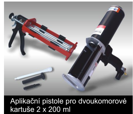
Aplikační pistole pro dvoukomorové kartuše 2 x 200 ml