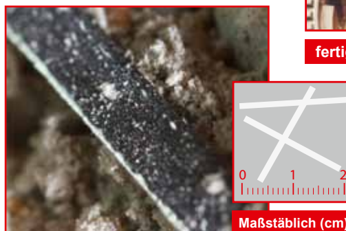
Mikroskopische Vergrößerung der Faser